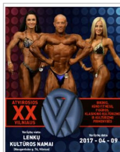
2017 m. VP afiša

2017 m. VP organizuojamos 20-tą kartą. Atsekti jų chronologinę seką nebuvo taip paprasta, tam prireikė daugiau nei dešimt metų tiriamojo darbo. Tyrinėjant Vilniaus varžybų organizavimo istoriją ir statistiką susidūrėme su problema, nes nėra išlikusių varžybų archyvo. Yra tik pavienių varžybų protokolai ar trumpi pranešimai spaudoje. Galbūt laikui bėgant atrasime daugiau informacijos, todėl šis darbas yra tęsiamas.