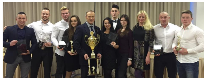
Geriausias – Marijampolės sporto klubas „Taurus“