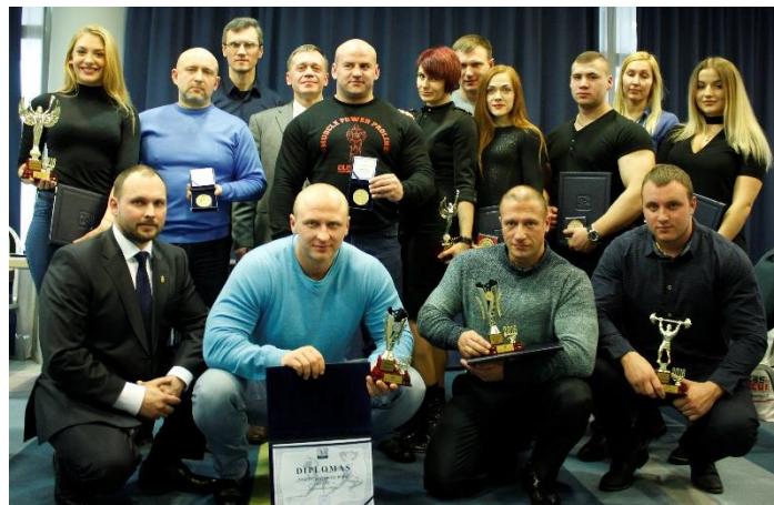
Reitingų laureatai ir Sąjungos vadovai

Visi reitingai paskelbti: www.kfsajunga.lt . Daugiau nuotraukų: www.facebook.com/Vilniaussajunga .